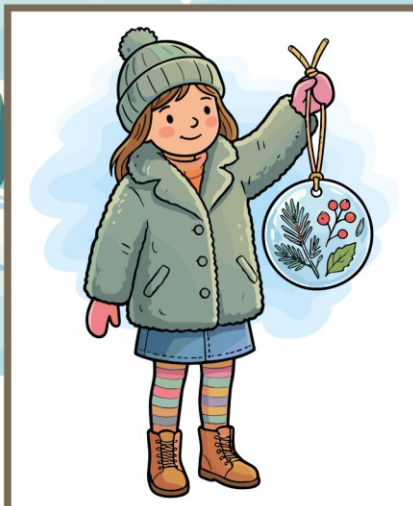
de ijs hanger