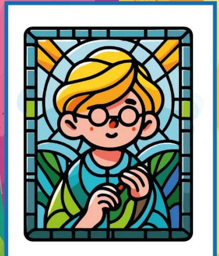
glas in lood