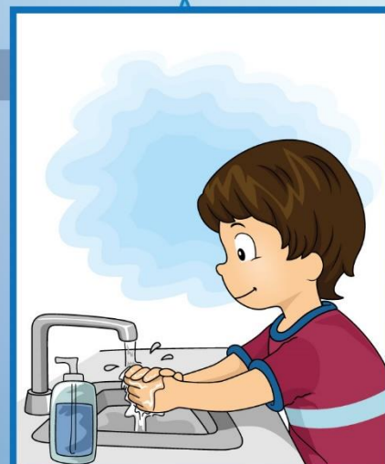
het handen wassen