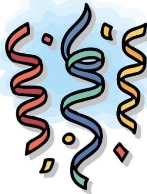
de serpentine s