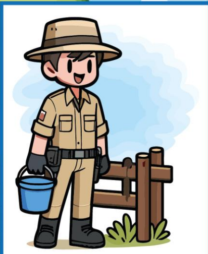
de dierverzorg er